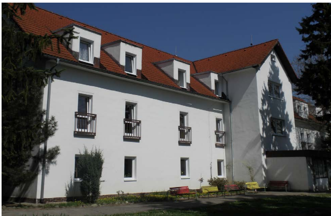
budova v Modre – Kráľovej - súpisné číslo 1480 (parcelné číslo 3210/2.3.6) :